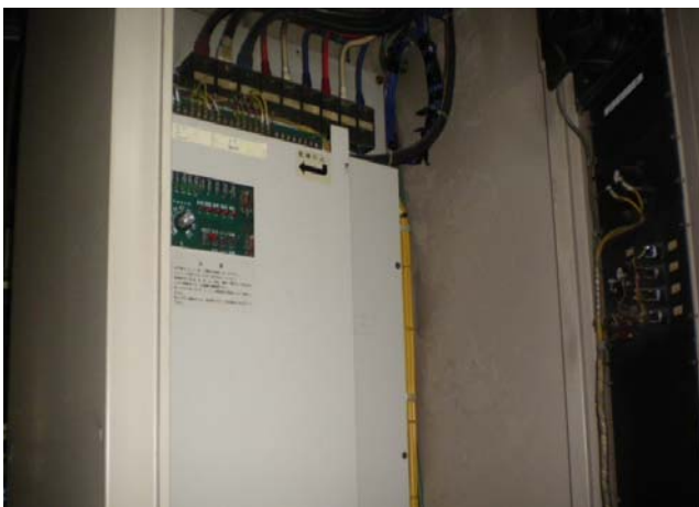
インバータ 更新前