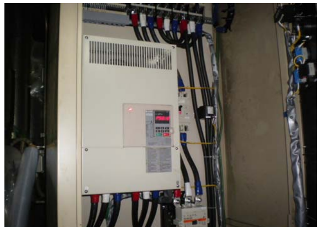
インバータ 更新後